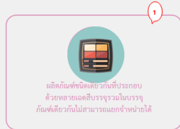
ผลิตภัณฑ์ชนิดเดียวกันที่ประกอบด้วยหลายเจดสีบรรจุรวมในบรรจุภัณฑ์เดียวกันไม่สามารถแยกจำหน่ายได้