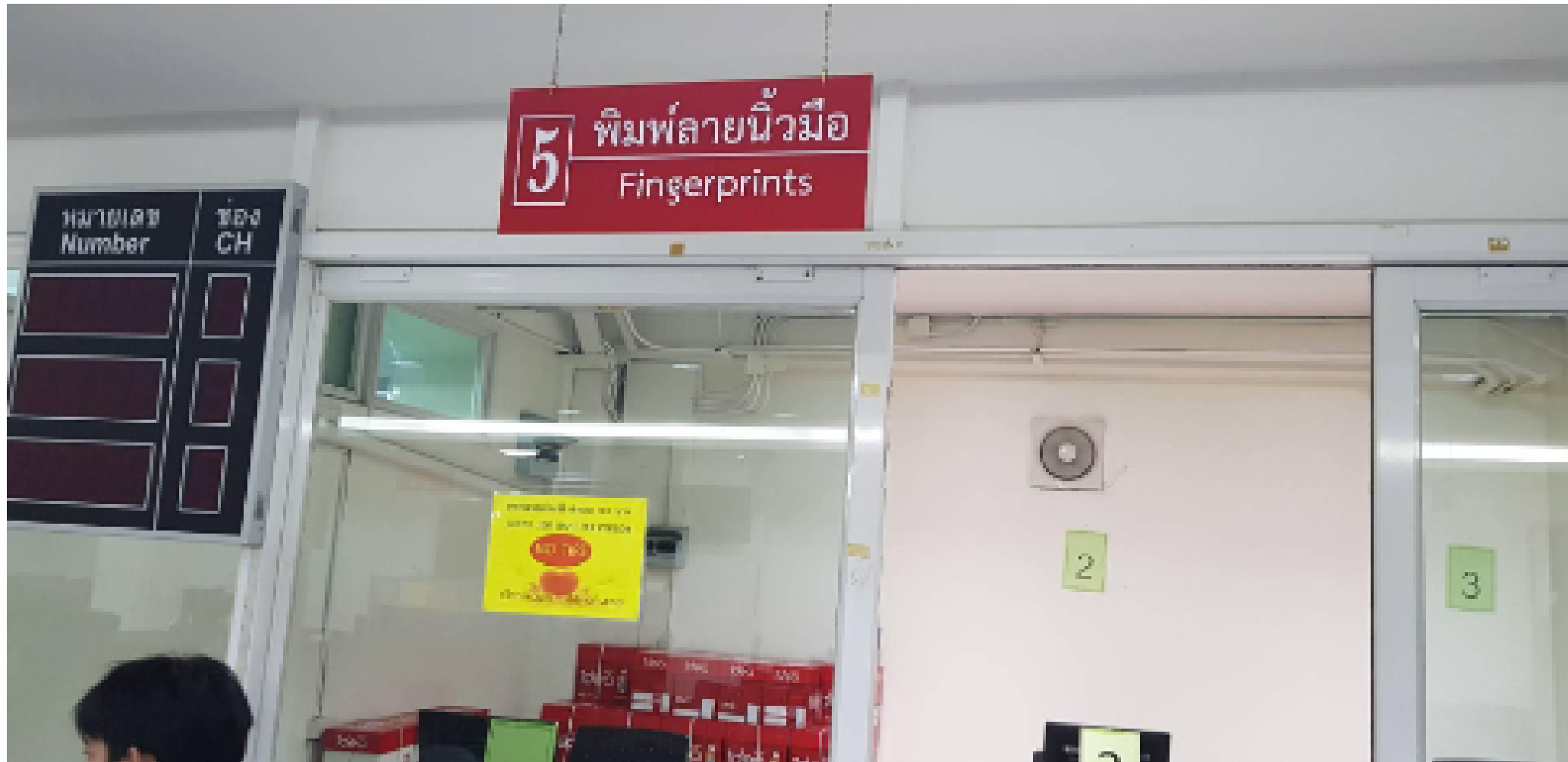
รอเรียกชานตามคิว